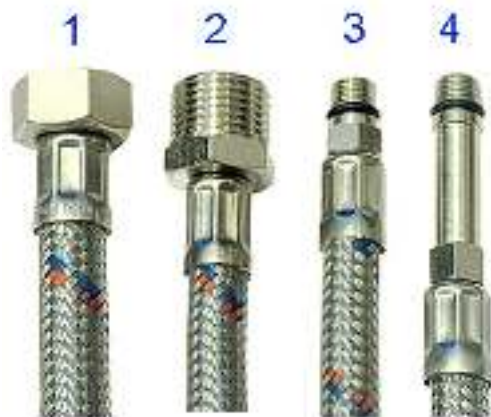
ПОДВОДКА ГИБКАЯ ДЛЯ ВОДЫ

Произведено по технологии: VALTEC s.r.l., Via Pietro Cossa, 2, 25135-Brescia, ITALY Изготовитель: CIXI SPAIL SANITARY WARE CO., LTD, Xijie Village, Xinpu Town, Cixi City, Zhejiang province, China, 315322